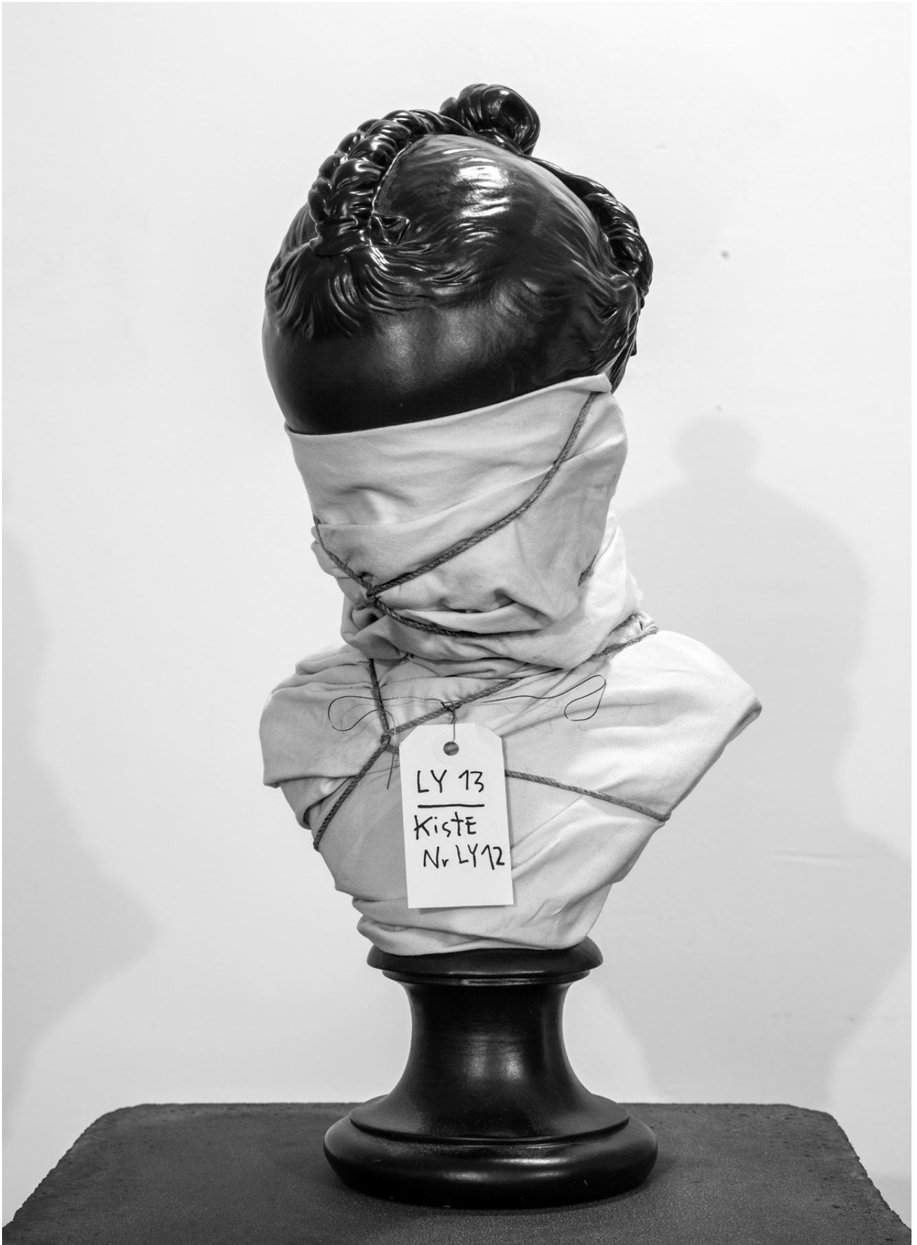
LY 13 - La loi normale des erreurs : statuares / textile, cordage, encre et graphite sur étiquette / 45 x 20 x 18 cm

Né en 1979 à Paris, vit et travaille entre Paris et Bruxelles.