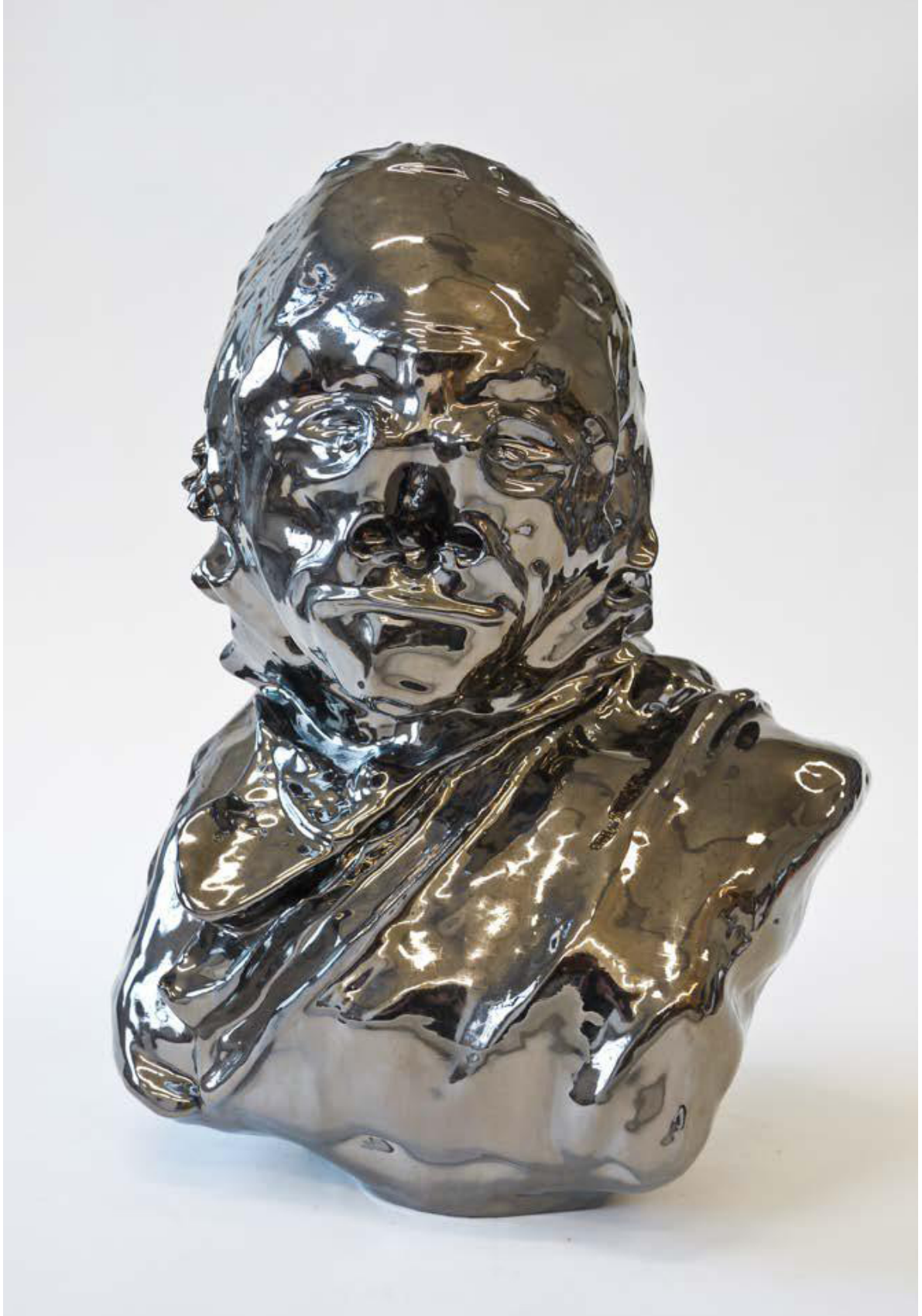
Eriatlov / céramique, émail bronze / 45 x 42 x 30 cm

Né en 1975, il vit et travaille à Genève.