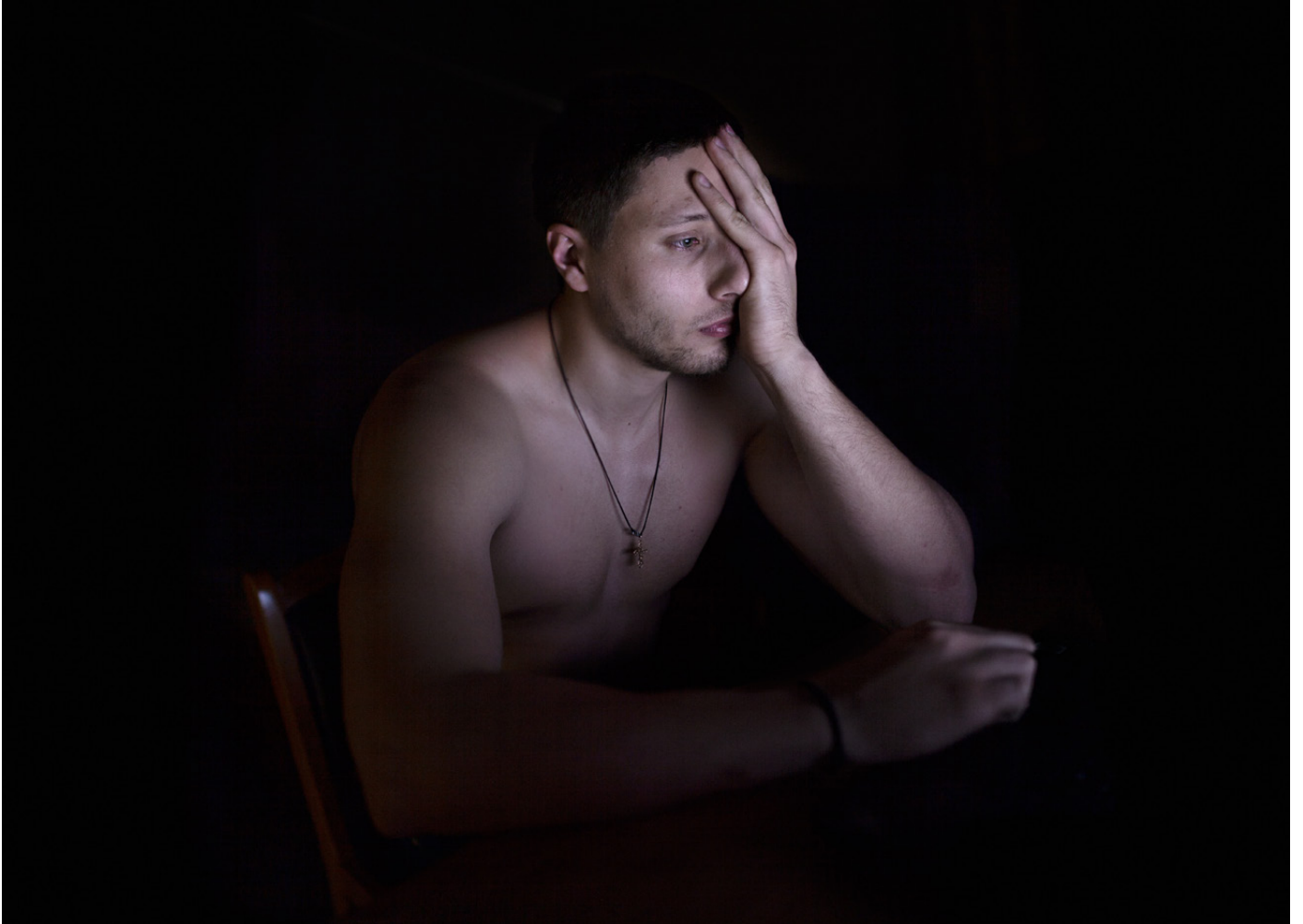
The Crossing / photographie numérique / 82 x 114 cm

Vit et travaille entre Paris et Athènes.