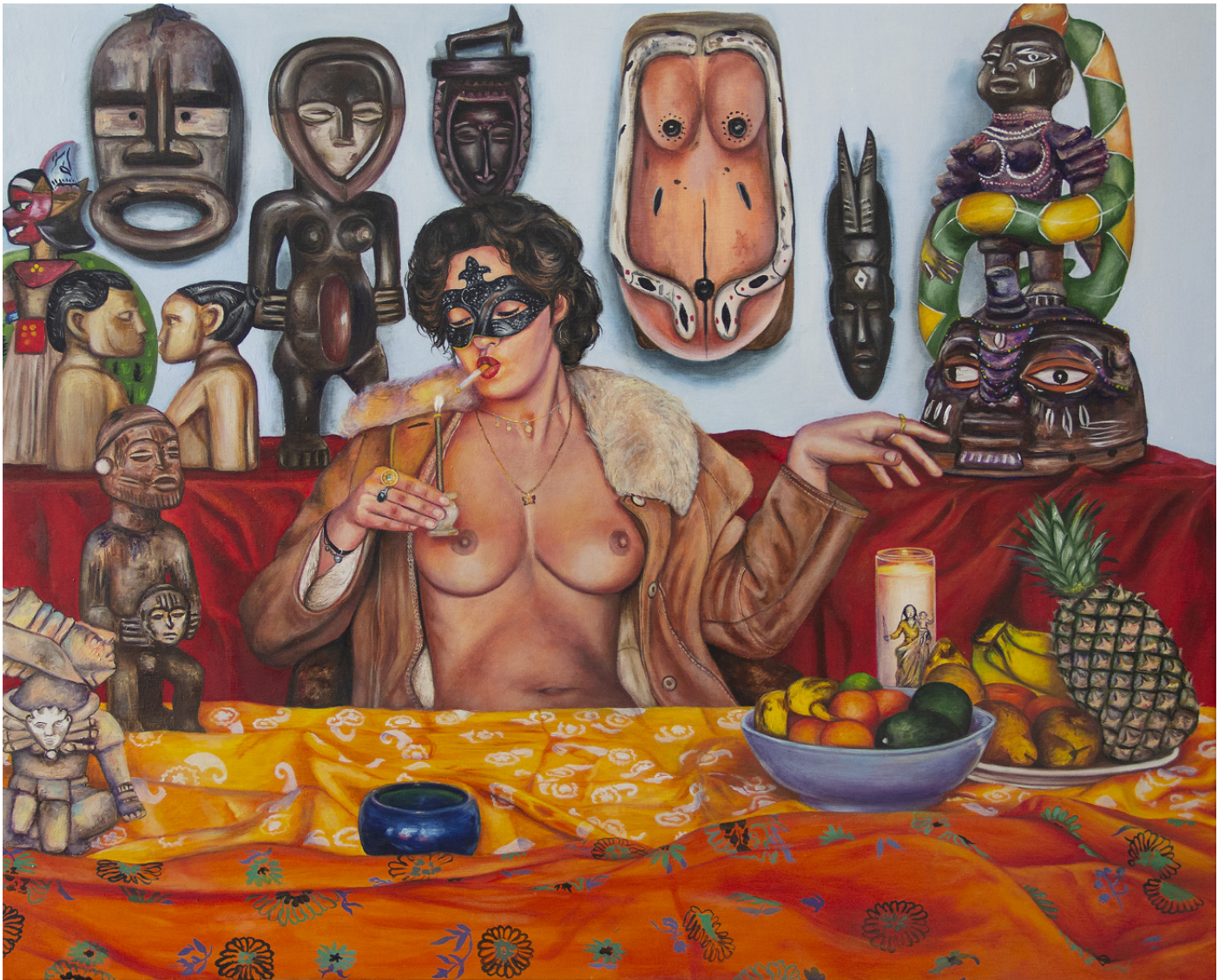
Notre Dame de la Mer / huile sur toile / 81 x 100 cm

Née en 1981 à Téhéran. Elle vit et travaille à Paris.