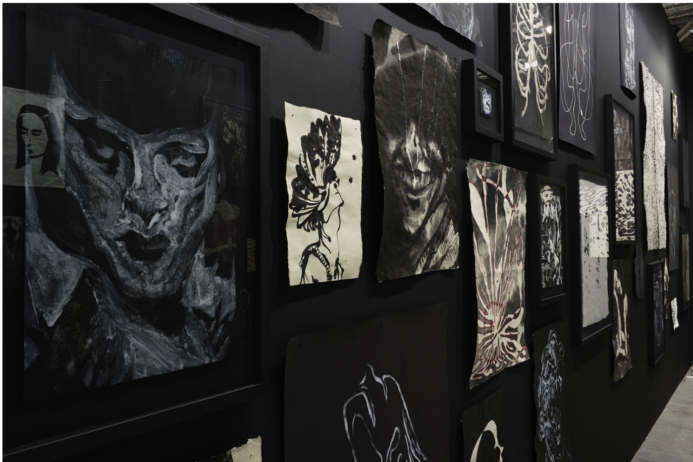
Ink Kingdom / vue de stand Art Stage Singapour

Né en 1983 à Paris. Il vit et travaille entre la France, les États-Unis et le Vietnam.