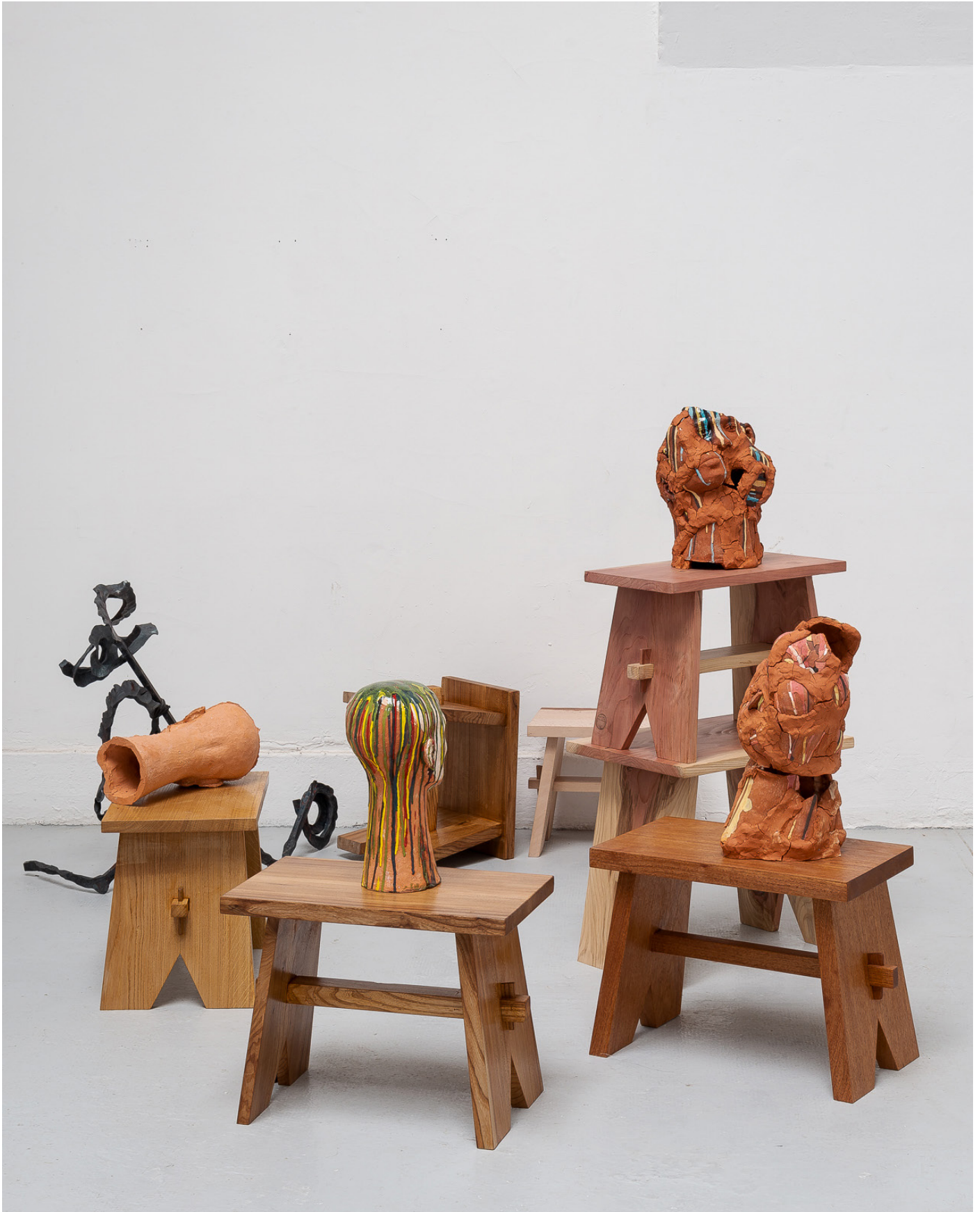
Le Parlement / vue d'atelier / proposition variable

Né en 1989 à Lomé (Togo). Il vit et travaille entre Amsterdam et Paris.