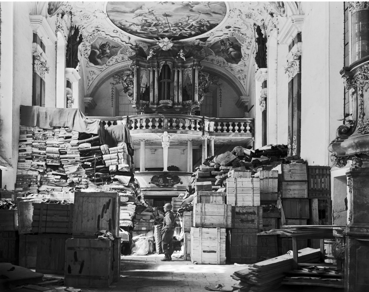
CORPUS : LA LOI NORMALE DES ERREURS : TRANSFER PLACE STOCKAGE DE L'ÉGLISE D'ELLINGEN, BAVIÈRE

Épreuve photographique US Army archives 1945