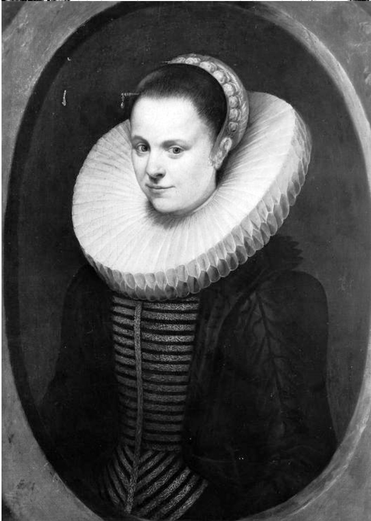
Holländ. 17. Jh. Bildnis einer Frau mit Radkragen, goldener Nadel und Perle im Haar, goldener Mütze mit weissen Rüschen, schwarzem Damastkleid und Weste mit Goldbordüren vor olivgrünem Hintergrund. Im Oval. - Öl auf Lwd., viereckig, gerahmt. - 76 x 55 cm. - Inv.-Nr.: MA-B 226 Foto-Nr.: 165

ERR Nom de la collection (MA-B) Möbel-Aktion Bilder ERR Inventaire N°